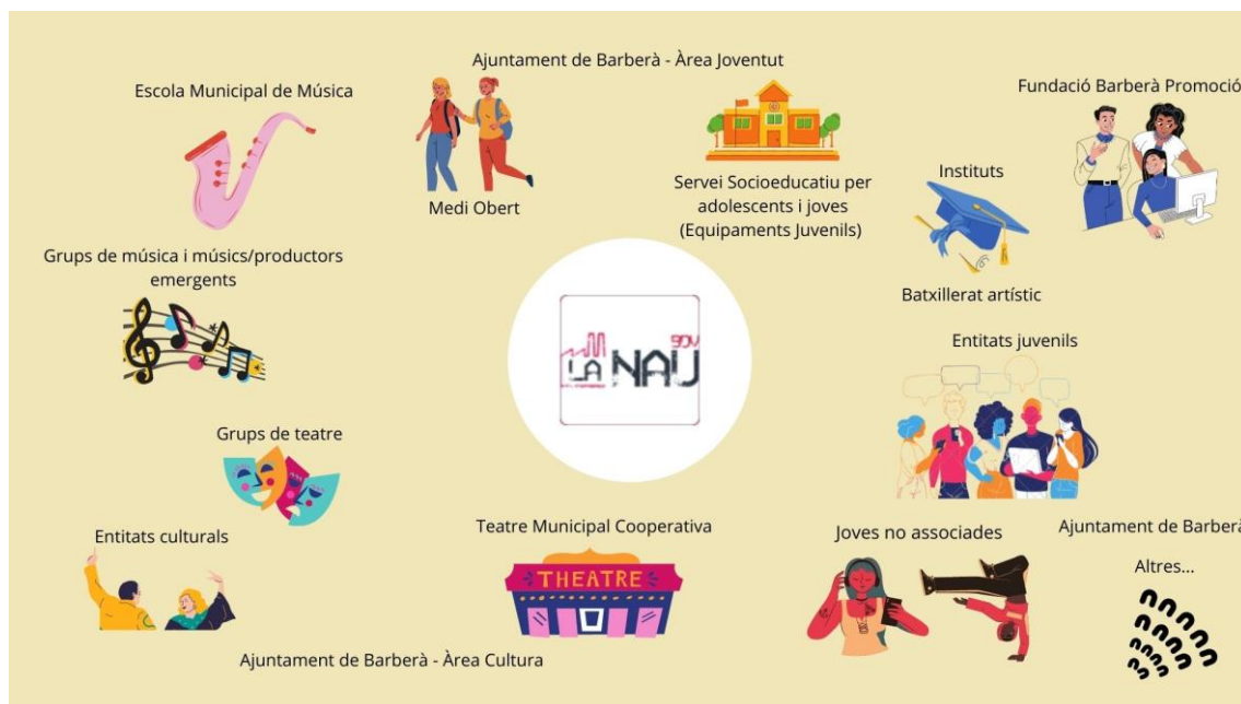
Mapa d'agents vinculats a La NAU. Elaboració pròpia a partir dels resultats de la diagnosi

És molt important identificar quins agents hi ha a Barberà, aquells que potencialment puguin teixir vincles amb l'equipament i puguin formar part del projecte; i anar revisant aquesta relació d'agents que serà canviant al llarg del temps. A continuació es mostra una infografia dels agents que actualment s'han identificat per poder teixir aliances des de La NAU, així com formar part de la mateixa xarxa comunitària.